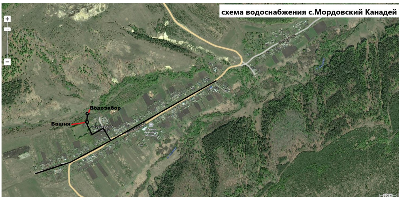
схема водоснабжения с.Мордовский Канадей